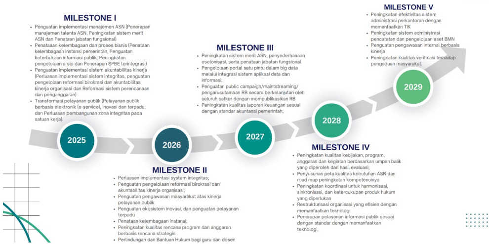
Gambar 3 8 Strategi Tata Kelola Organisasi Kementerian Agama Republik Indonesia

Sebelum menentukan arah kelembagaan, berdasarkan visi dan misi kementerian Agama, program prioritas Kementerian Agama difokuskan pada beberapa aspek utama, yaitu penguatan kerukunan umat beragama, transformasi digital, dan penguatan pendidikan keagamaan. Penguatan kerukunan umat beragama dilakukan melalui peningkatan kapasitas Forum Kerukunan Umat Beragama (FKUB) dan penyelenggaraan dialog lintas agama untuk mencegah konflik. Transformasi digital diwujudkan melalui pengembangan layanan keagamaan berbasis digital, termasuk sistem informasi terpadu untuk layanan haji dan umrah. Dalam bidang pendidikan keagamaan, Kementerian melakukan revitalisasi kurikulum moderasi beragama di semua jenjang pendidikan serta penyediaan madrasah dan fasilitas pendidikan keagamaan yang inklusif.